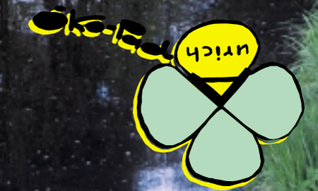
An der Ehe